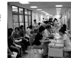
昨年のホスピタルフェア

例えば、「地域と共に生きる加西病院」「来て見て感じて加西病院」など、病院に希望すること、応援したい気持ちなどを30字以内で表現してください。フェアでは、医療相談コーナーや健康チェックコーナーのほか、コンサートや講演会の開催を予定しています。