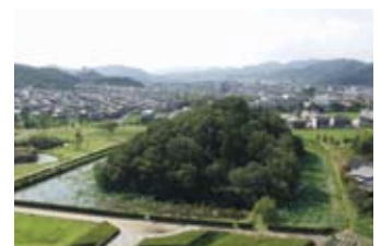
根日女悲恋伝承の舞台として知られる玉丘古墳

【問合せ】 ふるさと創造部・秘書課 ☎428701 教育委員会・文化スポーツ課 ☎428775