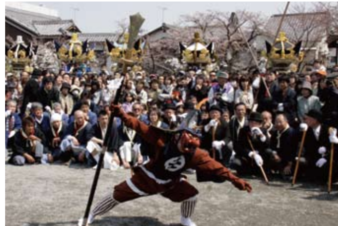
▲龍王舞（県指定民俗文化財）

桜の季節の訪れとともに4月7・8日、「北条節句祭り」が北条町北条の住吉神社周辺で開催されました。