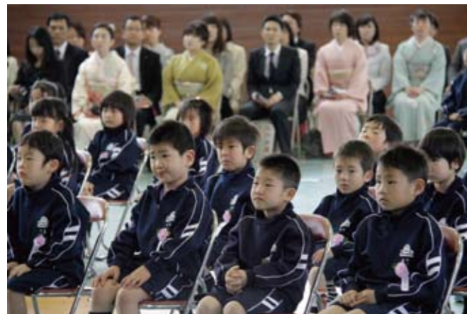
▲泉小学校での入学式。新1年生28人