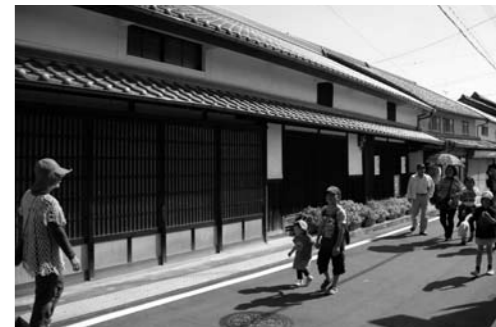
北条の宿はくらんかいは行われる北条町の旧市街地

旧街道沿いに伝統的な町屋や社寺が集積し、歴史的景観資源が色濃く残る北条町旧市街地において、兵庫県景観の形成等に関する条例に基づく、歴史的景観形成地区の指定を受けることになりました。平成24年6月1日より施行されます。