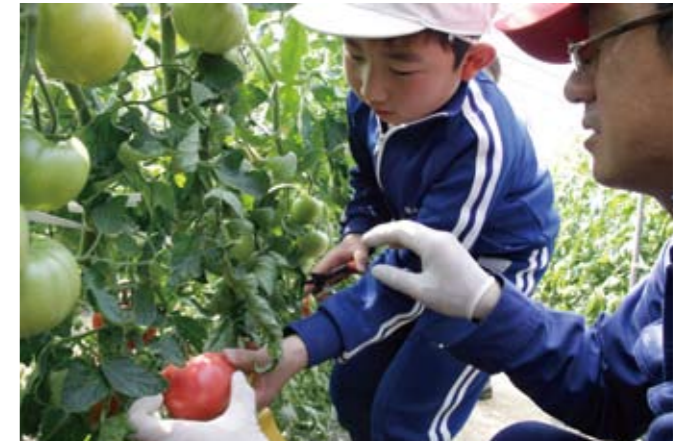
▲トマトを摘む九会小学校の児童

九会・富合・宇仁小学校の3年生が、社会見学の 일환として小学校区にあるトマト農園を訪れ、農家から栽培方法や生育の様子などを学びました。