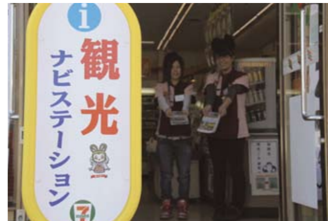
▲店先に置かれた加西観光ナビステーションの看板（高さ約1m）

加西市観光まちづくり協会は、セブン-イレブン・ジャパンの協力を得て、4月1日から市内の同コンビニ7店舗で、「加西観光ナビステーション」を開設しました。店員が観光地や交通ルートの案内、観光ガイドマップの無料配布のサービスを行います。