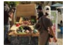
軽トラの荷台で野菜を販売する様子

【問合せ】 はくらんかい事務局(市商工観光課・観光振興係) ☎428740 FAX431802 shokokanko@city.kasai.lg.jp