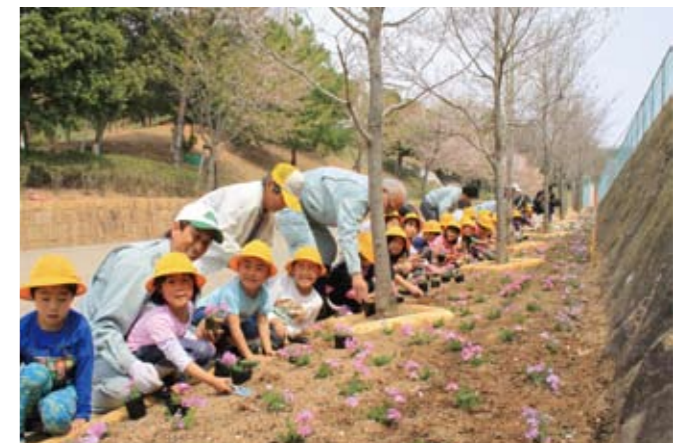
▲約1200本のシバザクラの苗が植えられた花壇

丸山総合公園で4月19日、地元の北条東幼稚園の園児28人がシバザクラの苗を植えました。