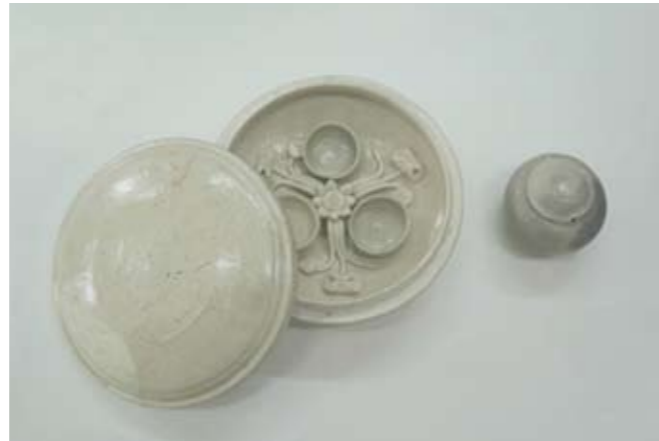
▲白磁合子と小壺（右）

倉狭間遺跡（畑町）から出土した陶磁器、白磁合子・小壺が、県立考古博物館（播磨町）の特別展「清盛と日宋貿易」で展示されています。6月24日（日）まで。