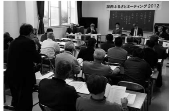
2月に行われたタウンミーティング