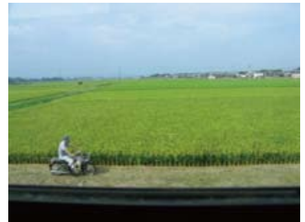
北条鉄道の車窓から撮影した写真(例)

全国の多くの方々に、車窓から見える一瞬一刻の貴重な景観資源を知っていたら、鉄道の利用促進につながります。詳しくは、ホームページをご覧ください。