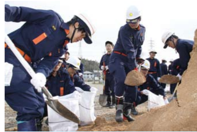
▲水防訓練で土嚢づくりをする消防団員

加西市消防団の部長・新入団員・水防訓練及び機関員講習が4月15日、兵庫みらい農協の駐車場を中心に実施され、消防団員約500人が参加しました。