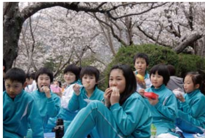
▲桜の木の下で給食を食べる子どもたち

賀茂小学校では4月10日、子どもたちが桜の木の下で花見をしながら給食を食べました。