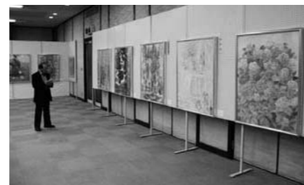
各部門の出品作品を展示した加西市美術家公募展が11/19～23の期間、市民会館で開催されました。

【問合せ】 自己実現サポート課 ☎428775 FAX41803 koryu@city.kasai.lg.jp