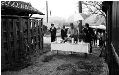
法華口駅での地鎮祭。駅の隣に建設予定。

鉄道の活性化に役立ててくださいと、10月下旬に市民の方から寄付のあった100万円はこれらの事業に使われます。