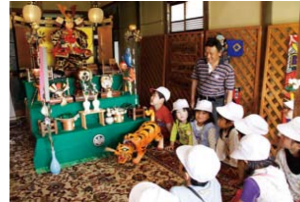
▲「まちなみ五月人形めぐり」を楽しむ園児たち