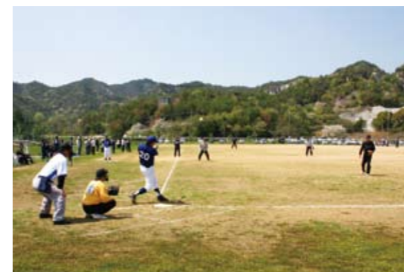
▲各会場では地域の交流と熱戦がくりひろげられました