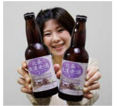
▲列車の色である紫を基調としたラベル

ラベルは、市内アマチュア画家が描いた旧北条町駅舎の水彩画を配して、大正ロマンが感じられるようなデザインです。良質のアロマホップを使用し、飲みやすくスッキリとした味わいで、ホップの程良い香りも感じられる仕上がりになっています。6本セット2,700円(北条鉄道ホームページ http://www.hojorailway.jp/ )