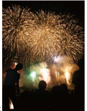
フィナーレを飾る花火