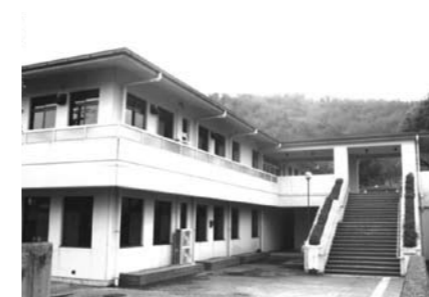
教育総合センター

開館時間 平日：8:45～20:30 土曜：8:45～17:00 日曜・祝日は休館