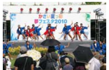
昨年のパフォーマンス