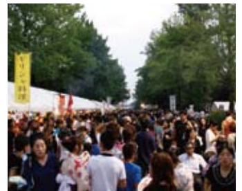
賑わった、昨年のかさい満載市場