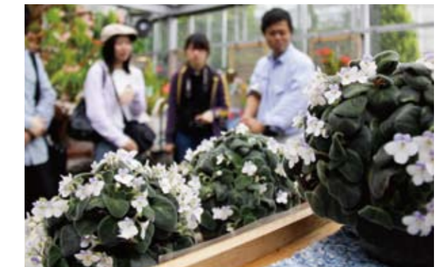
▲小さな花をたくさん咲かせたセントポーリア・ゲッツィアーナ