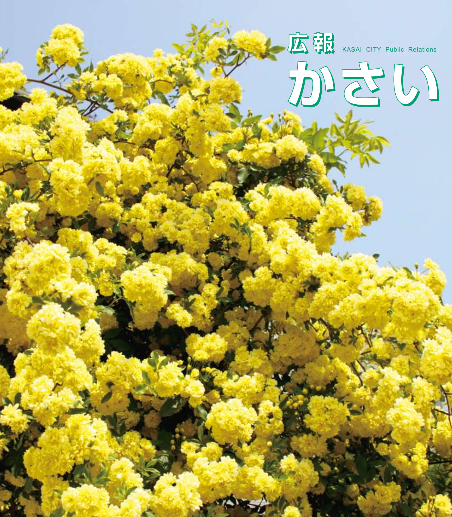
木香バラ（北条町横尾）

表紙の写真(市内の美しい花や風景など)を募集しています。 詳しくは経営戦略室までお問い合わせください。