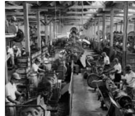
昭和40年代頃の三洋電機製作所北条工場