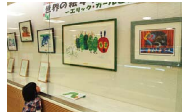
▲ベストセラー絵本「はらぺこあおむし」の原画を展示

また図書館前では、絵本「はらぺこあおむし」で有名な米国の絵本作家エリック・カールさんの貴重な原画展も開かれ、その鮮やかな色彩が道行く人達の目を楽ませました。