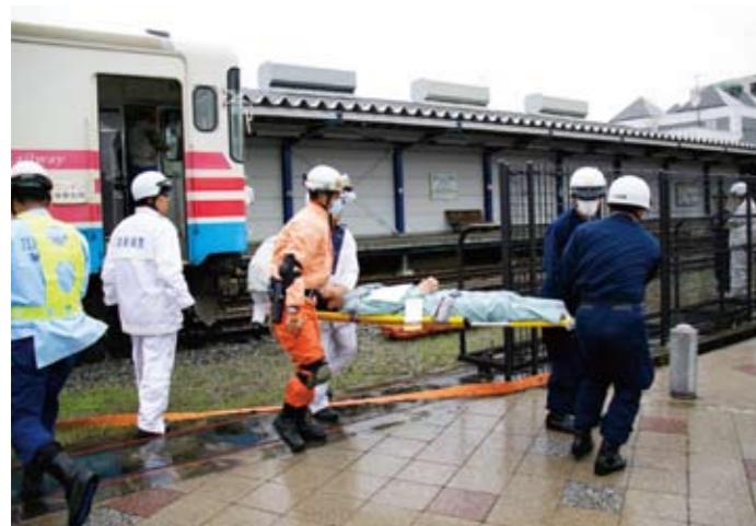
▲負傷者役を応急手当し、速やかに救急車へ運び込むなど本番さながらの訓練。