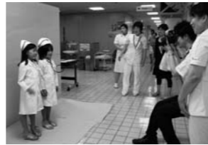
人気の医療者制服着用体験コーナー

※注意事項／動脈硬化度・骨密度測定は、当日に抽選。抽選は時間毎に行い、先着順ではありません。