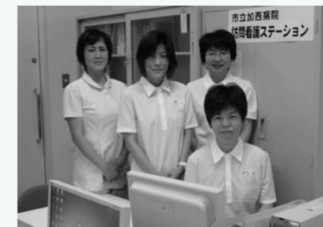
訪問看護ステーションのメンバー