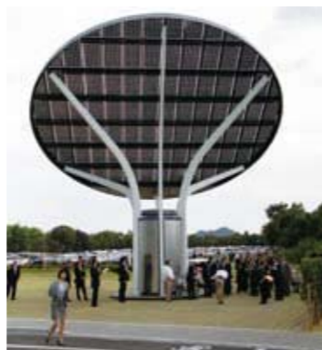
◀加西グリーンエナジーパーク

この度、次の4団体が「加西市まちづくり大賞」を受賞されました。この賞は、まちづくりの伸展に著しく貢献された個人や団体を讃えることを目的として平成20年10月に創設。今回は2回目の表彰です。