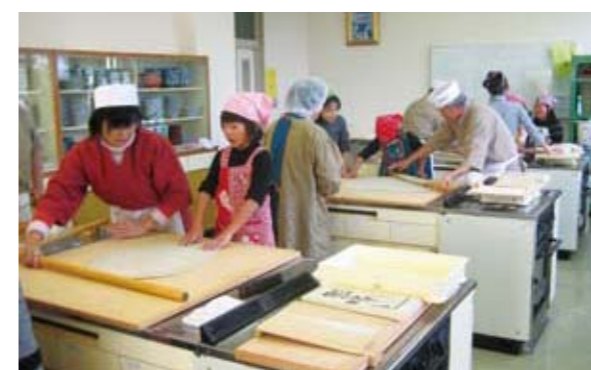
▲「播磨蕎麦の会」のメンバーから手ほどきを受ける参加者