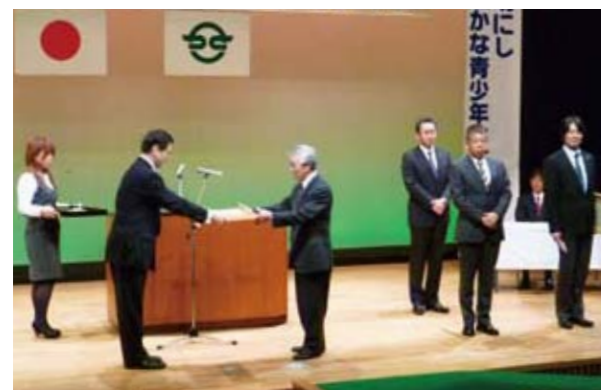
▲昨年11月に健康福祉会館で開催された表彰式

交歓会は、市内の個人や各種団体、企業の協賛・協力も得て市民参画の形式で開催するもので、200人を超える方々が参加。新年の門出を祝うとともに、抱負や希望を語り合う中で交流を深めました。