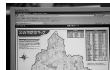
市ホームページの防災マップ

問合せ先 ／安全防災課 ☎④8751 FAX④1800 bosai@city.kasai.lg.jp