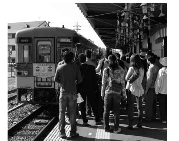
注目された国内初の BDF100%での営業運行

植物由来の BDF 利用は、車両走行時に排出される二酸化炭素（CO2）が菜の花などの成長過程で吸収・蓄積したもので、燃焼させても大気中の総量は変わらない（カーボン・ニュートラル）という環境特性があります。