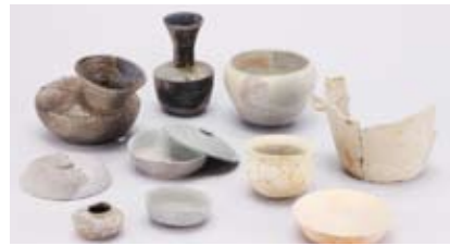
市史に掲載の奈良時代の土器(鴨谷遺跡)

販売場所／市史編集室(市団体事務所)、教育委員会事務局、地域交流センター、市内公民館、西村書店・毛利書店