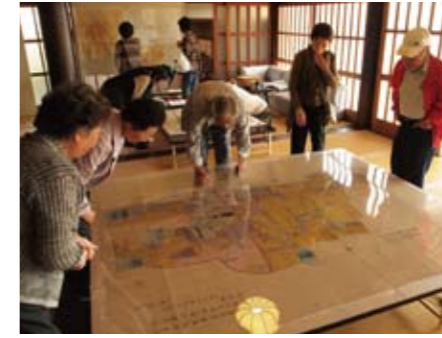
▲大信寺で江戸・明治時代の絵図面複製品を展示