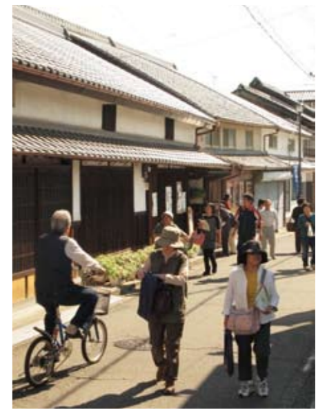
▲歴史的な町家が残る通りをそぞろ歩きする参加者。両日とも天候に恵まれ、たくさんの人手で、「かつての賑わいを思い出し、とても懐かしい」との声も聞かれました。