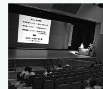
【写真】 第4回加西病院市民フォーラム 9月30日「地域で守る病院医療」と題して第4回加西病院市民フォーラムを健康福祉会館で開催しました。参加者は120名余りで、病院職員ばかり目につく寂しい市民フォーラムとなりました。