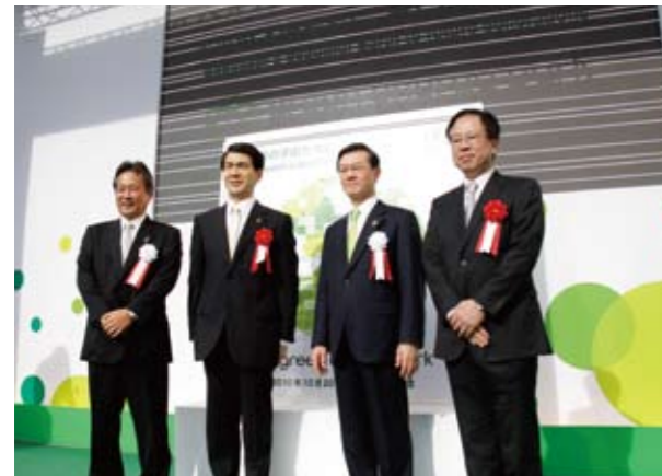
▲新工場完成を祝い、三洋電機佐野社長（左）やパナソニック大坪社長（左から3人目）ら関係者約300人が出席して盛大に記念式典が行われました。