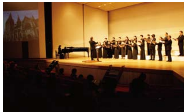
▲舞台向かって左には、曲にちなんだ海外の風景画像を投影し、世界旅行の気分を演出

同協会が9月に実施した「ご当地バーガー選手権」で優秀賞に選ばれた3作品をもとにサービスエリアの料理長が商品化しました。市内で製造されるエコフード（食品廃棄物再生飼料）で育てた「ひょうご雪姫ポーク」のハンバーグを「加西ゴールデンベリーA」を使ったしょうが焼きソースで味付け。紫黒米のおにぎりも加え、上下を加西産の米粉パンで挟んでいます。