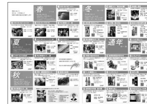
季節に応じた加西産品をお送りする「ふるさと納税カタログ」

【問合せ】 財政課財政担当 ☎48710 FAX41586 zaisei@city.kasai.lg.jp