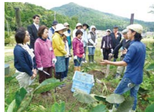
▲「草竹」の二人の説明を熱心に聞く参加者

気持ちのいい汗をかいた後は、近くの原始人会交流館で、地元食材をふんだんに使った「どいなか定食」が振る舞われました。