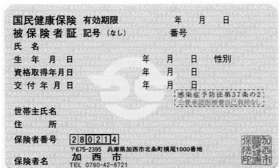
一般被保険者証（縦 5.4cm×横 8.6cm）

不在で保険証を受け取られなかった場合は、郵便局で12月5日頃まで保管されます。その後は国保健康課に戻ります。その他ご不明な点は下記までお問い合わせください。