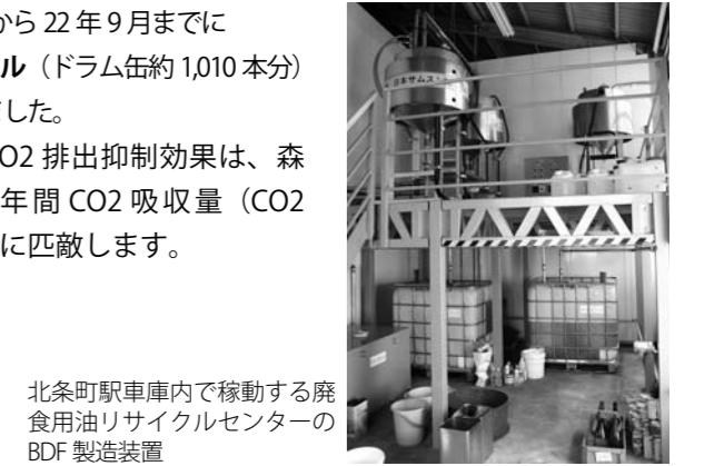
北条町駅車庫内で稼働する廃食用油リサイクルセンターの BDF 製造装置

これによる CO2 排出抑制効果は、森林約 70ha 分の年間 CO2 吸収量（CO2 約 530 トン分）に匹敵します。