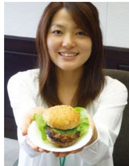
◀加西産の食材をへらへと（沢山を意味する播州弁）使用したオリジナルバーガー

太鼓の勇壮な演奏でスタート。約600名の参加者は、最長約8kmのハイキングコースなどに挑み、満開のコスモス街道を楽しみました。