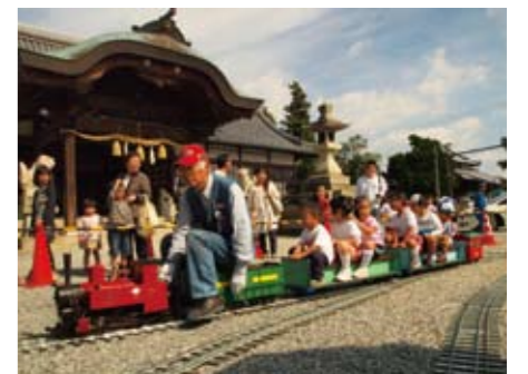
▲子供たちに大人気のミニSL