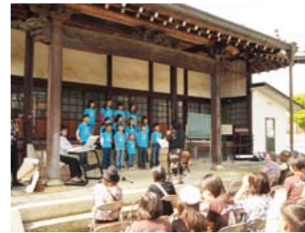
▲西岸寺ではさるびあっ子が合唱を披露

地域住民が主体となり企画・運営された同イベントは、まちなかにある寺や神社、空き家、空き店舗を利用し市民参加によるカフェやギャラリー、芸能など多彩な催しが繰り広げられ、二日間で市内外から約3万人が来訪。普段静かな町通りが多くの人で賑わい、参加者と地域の方々との語らいがそこかしこに見られました。