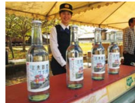
▲北条鉄道開業25周年記念サイダー