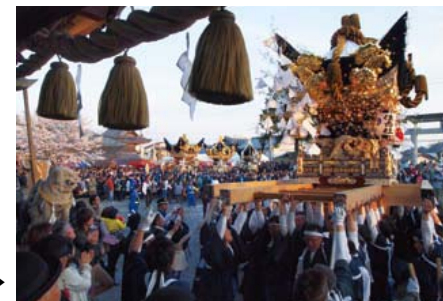
最終日の住吉神社への宮入 ▶

「北条節句まつり」は、優美さと勇壮さが織りなす華やかな春の祭りとして有名で、播磨三大まつりの一つに数えられ900年近い歴史と伝統を引き継いでいます。東西の神輿、13台の豪華な屋台が街中での巡行と勇壮な宮入を行い、古式ゆかしい鶏合せ神事や龍王の舞などを奉納。晴天にも恵まれ、祭りは終日大勢の人出でにぎわいました。