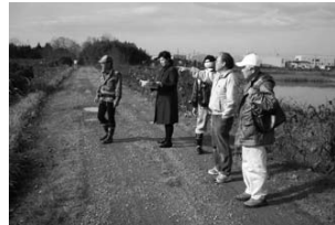
新たな観光資源の開発 (エコツーリズム推進アドバイザー事業) (H21.12/12)