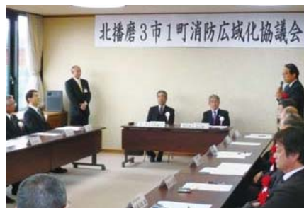
消防広域化協議会の開所式。自治体の首長や議長が出席 ▶

地域の消防力を増強するため平成24年度中の業務開始を目指し、運営計画の策定や一部事務組合設立に向けた作業が進められます。