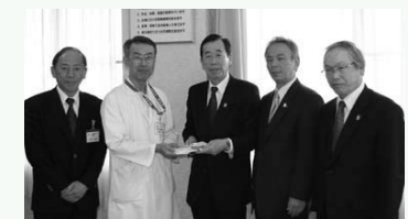
【写真】JA兵庫みらいからご寄付を頂く（3/30）

病院へのご寄付は、社会全体への尊い貢献として感謝の念に堪えません。病院をより良く発展させるための資金として、また職員一同に頂いた支援のお志として十二分に活用させていただきます。本当に有難うございます。