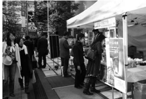
東京日本橋でのイベントに出店 (H21.11/6)