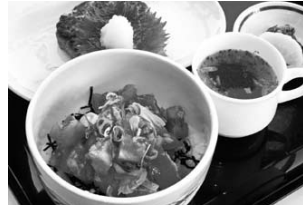
自慢のレシピコンテストで郷土料理の開発 (H21.10/31)