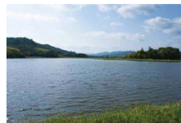
▲ため池百選に選定された長倉池