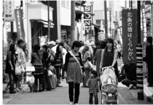
北条の宿はくらんかい (H21.10/17・18)