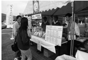
かさい満載市場 加西 SA (H20.11/2)