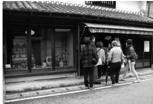
北条の宿ひな飾りみてあるき (H22.3/7)