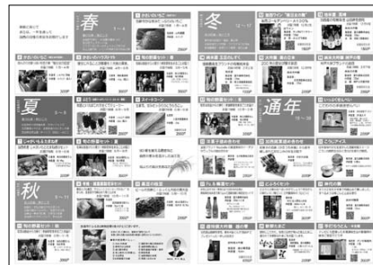
ふるさと納税カタログ