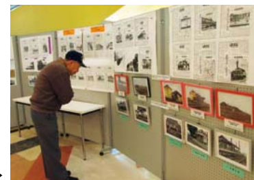
新聞記事や写真を展示 ▶

北条線開通時に住吉神社の屋台19台が繰り出し、北条町駅周辺は大変賑わったことを伝える当時の新聞や、北条線をSLが走る写真などが展示され、来場者は懐かしげに見入っていました。