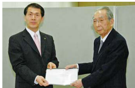
▲塩川会長（右）から最終報告書を受け取る中川市長