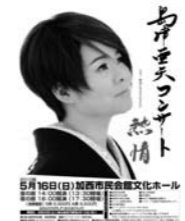
島津亜矢コンサート