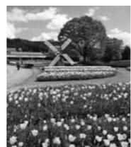
フラワーセンター

加西市観光まちづくり協会では、鉄道各社(北条鉄道・神戸電鉄)、兵庫県立フラワーセンターと連携してハイキングを実施します。鉄道沿線に咲く菜の花畑や国内最大級「450品種30万本」のチューリップが満喫でき、加西市の魅力がたっぷりのハイキングフラワーセンターです。 コース概要：長駅～播磨横田駅～三洋電機鎮岩工場前～フラワーセンター～播磨横田駅 開催日：4/11(日) 集合：北条鉄道「長駅」10:30 備考：フラワーセンター入園料無料 ※ハイキング参加者に限る 問合せ：ふるさと営業課☎④8740