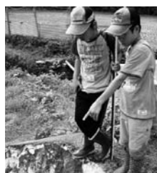
あぜみち探検の様子

「遊び」と「学び」がつまったネイチャーゲームを親子でワイワイ楽しもう。親子で見つけた食材でアウトドアクッキングにもチャレンジ。