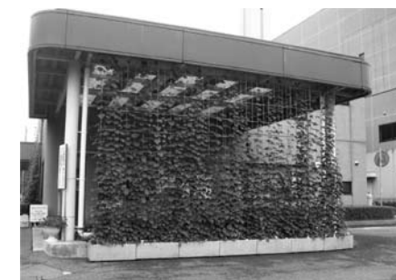
庁舎やクリーンセンター・幼稚園等で緑のカーテンを実施。

取組状況において、2年目となる20年度は、19年度に引き続き目標を達成することができました。今後も、低炭素社会の形成に向けて、CO2排出削減の取組を継続して図っていきます。