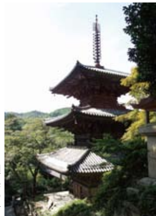
一乗寺三重塔(国宝) 建立は平安時代に遡るといわれる兵庫県下に現存する最古の塔婆。国指定文化財