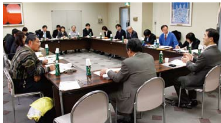
▲「無党派・市民派自治体議員と市民のネットワーク」の視察

事業仕分けや環境施策など、この2～3年多くの視察を受け入れています。21年度は他の市議会からの視察だけでも13件ありました。