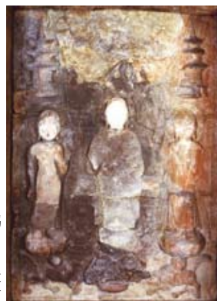
石造浮彫如来及両脇侍像(古法華石仏) 約1300年前に彫られた日本最古の石造彫刻。国指定文化財

【申込・問合先】 ☎675-2395(住所表記不要) 加西市体育協会事務局 ☎④8773 FAX④1803 koryu@city.kasai.lg.jp