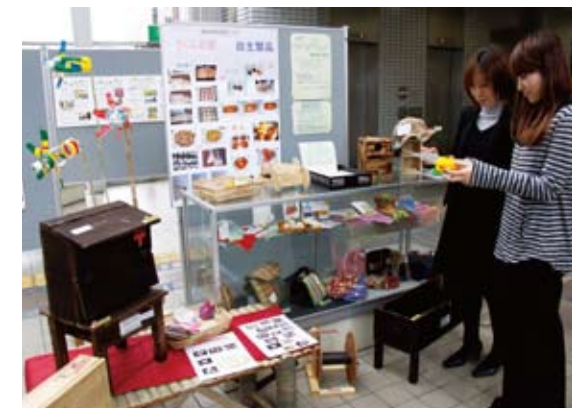
▲市役所1階市民ホールにて授産製品を展示中。