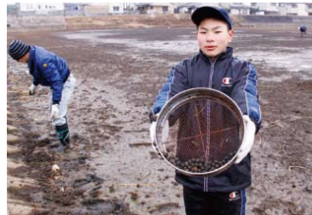
▲直径1cmのオニバスの種子を採取する参加者