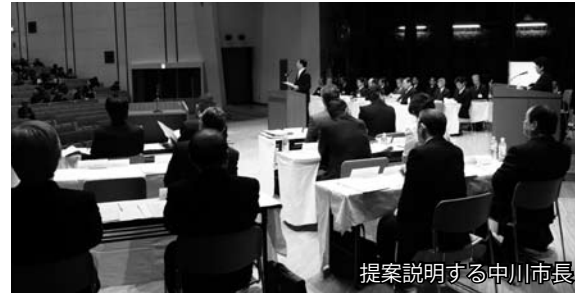
提案説明する中川市長

（なお、この頁は2月8日に作成しているため、4議案の採決結果は掲載できませんので、来月の広報かさいでお知らせします）