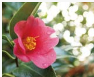
胡蝶ワビスケ(北条町:羅漢寺)