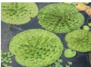
▲オニバス（環境省レッドデータ絶滅危惧II類）

池を管理する北条12区区長会や自然愛好家グループ加西ナチュラルリストクラブなどの協力を受け市環境創造課が実施。参加者は水を抜いた池底に散らばる種子を拾い、全員で約400個を採集しました。今後、専門家と相談の上、保存・栽培などを検討します。