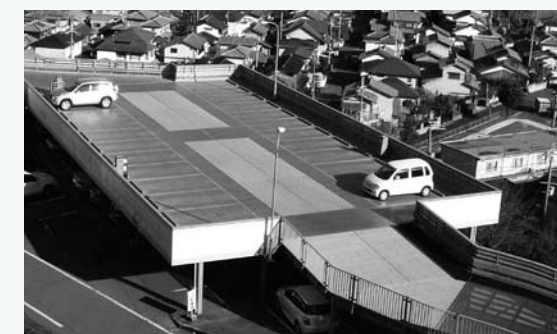
写真／立体駐車場をご利用ください 駐車場不足のご指摘を頂いています。玄関前が混み合う時間帯でも立体駐車場には空きがあることが少なくありません。看板で誘導しています。どうぞ、ご利用ください。