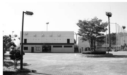
加西球場/年間100万円程度

加西球場、市民グラウンド、勤労者体育センターの3施設について、一昨年度に引き続きネーミングライツ・スポンサーを募集しています。応募に関するお問合せは下記までお願いします。