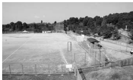
市民グラウンド/年間70万円程度