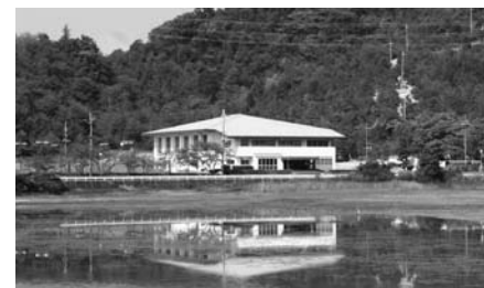
勤労者体育センター/年間50万円程度

【問合せ】 教育委員会教育総務課 ☎④8770 FAX④1803 kyoiku@city.kasai.lg.jp