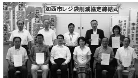
加西市レジ袋削減協定式（8/24 市役所） 事業者・加西市くらしと生活を守る会・行政の3者で「加西市レジ袋削減検討会議」を立ち上げ、4回の調整会議を重ね、協定に至りました。

市民・事業者・行政の協働による「ごみの減量化、地球温暖化防止、CO2の排出削減」を目指し、11月1日から、次のようにレジ袋削減を推進する計画です。