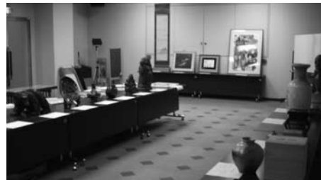
前回の公売物件下見会場 (6/5)

市税滞納者から差押えた不動産および動産をインターネット上で公売する「平成21年度第2回インターネットオークション」を開催します。