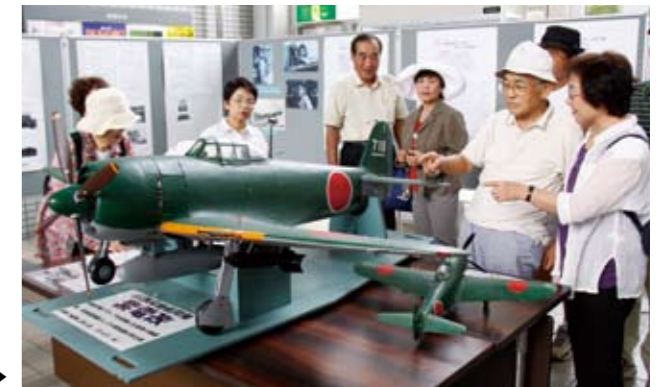
紫電改6分の1模型を展示▶

戦闘機「紫電改」をはじめ、多数の飛行機模型や予科練習生の写真など、その飛行練習生達に関する資料を展示。見学された方は、「飛び立たれる方、そして送り出す方の気持ちが伝わる展示でした」と感想を述べられました。