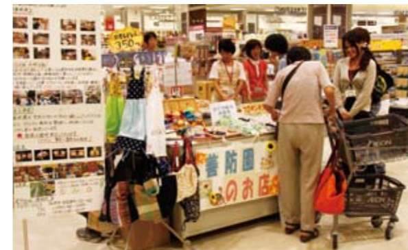
▲真心込めて作られた商品がずらりと並ぶショップ

■ 市立善防園では、一緒に活動する仲間を募集中。18歳以上の療育手帳をお持ちの方で通園できる方が対象です。詳細は、善防園(☎④ 3999)又は社会福祉課(☎④ 8725)まで。