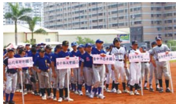
▲開会式。右から善防少年野球クラブ、泉少年野球クラブ