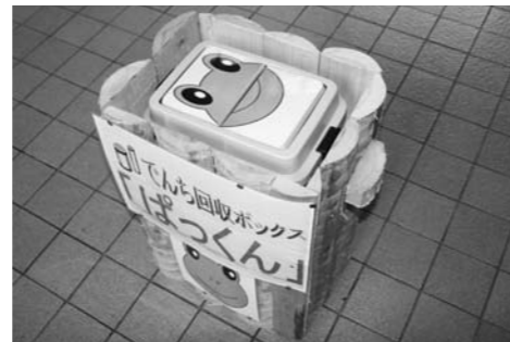
使用済み乾電池回収ボックス「カエルのぱっくん」 回収容器は廃材等を利用して作成。

※リチウム電池、ボタン型電池は、回収できません。購入された電気店等へお持ち込み下さいませようお願いします。