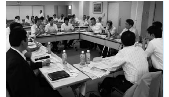
1事業につき、説明5分、討論30分、判定5分を目安に議論。積極的な意見交換が行われました。

仕分け委員は、他の自治体職員等による外部委員5名と市民委員5名、進行を行うコーディネーターの計11名で構成し、判定を行いました。