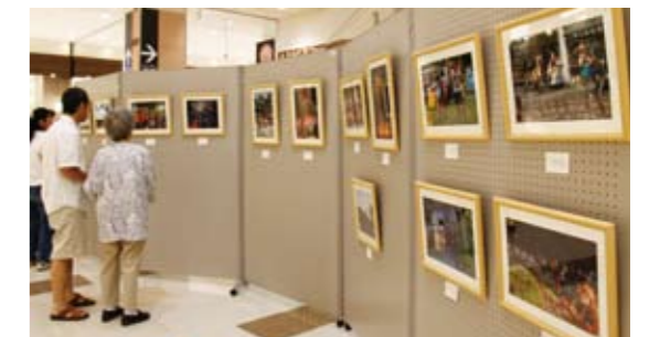
▲イオン加西北条ショッピングセンターでも9/5から16日まで展示、好評を博した作品展

8月2日に開催の『かさい夏っ彩夢フェスタ 2009』の会場を舞台に、「あなたの見つけた夏っ彩な瞬間」を題材とした、フォトコンテストを実施しました。県内各地の49名から123点もの作品が寄せられ、入賞作品27点を決定。入賞作品の展示会を9月18日(金)から30日(水)まで加西サービスエリア(上)で行います。フェスタ当日の迫力を楽しめる絶好の機会です。