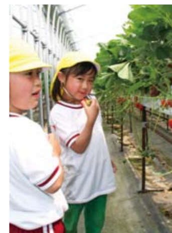
▲「甘くておいしい」と大喜び

いちごは、加西市の特産物の一つ。市内各地で栽培され、いちご狩りも盛んに行われています。子供たちが参加したその一部をご紹介します。