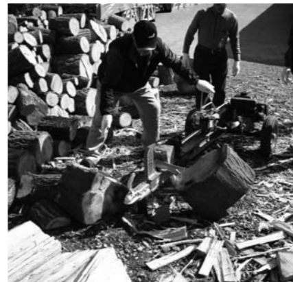
『与作プロジェクト』薪割りの様子