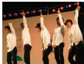
昨年のパフォーマンス

「おどり」は勿論、コーラス、漫才、楽器演奏など、パフォーマンスなら何でもOK。皆さんの参加をお待ちしております。