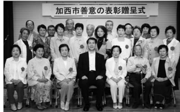
かしの木賞を受賞された皆さん