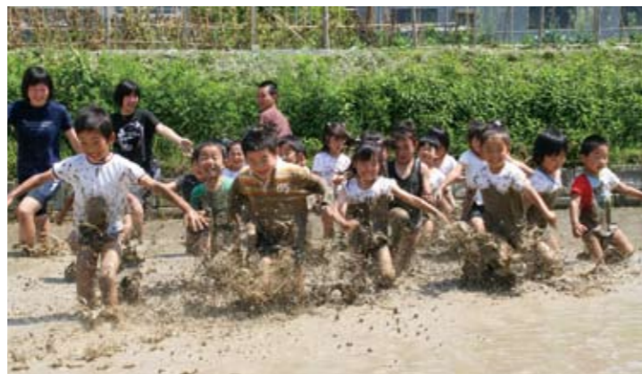
▲歓声をあげながら、どろんこになる子供たち

地域住民と保護者が見守る中、子供たちは、トライアルウィークの北条中学2年生6名と共に、素足になって全身で遊び、土や砂と異なったどろの感触を味わいました。