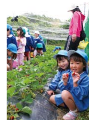
▲いちご狩りを楽しむ子供たち

5月11日、東剣坂町の野田いちご園で、市立賀茂幼稚園の園児54人が、いちご狩りを楽しみました。このいちご狩りは、野田いちご園が、地元へ何か貢献したいと、11年前からほぼ毎年、地元の子供達を招待し、開催されています。