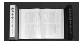
『加西市史』第九巻史料編3

県内の民謡や忘れていた唄を掘り起こし、地域にいつまでも伝えていくことを目的に開催します。優勝者には平成22年度NHKホールで開催される、「日本民謡フェスティバル2010」への出場を推薦。 日時：6/21（日）10:00開演 場所：健康福祉会館※入場無料 主催：兵庫県伝承民俗芸能文化協会 問合せ先：兵庫県民謡・名人戦実行委員会 ☎ 0795-72-1247