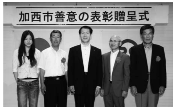
サルビア賞を受賞された皆さん

サルビア賞は、市の花である「サルビア」の群生の集団美をたたえる意味で団体に贈られます。