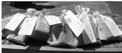
かぐや姫の消臭炭

また、本年3月からは、竹材の有効活用をめざす市の「かぐや姫プロジェクト」に取り組み、市立善防園との協同企画として、竹炭商品『かぐや姫の消臭炭』を作り、市内の様々な環境・福祉イベントなどでも販売しています。