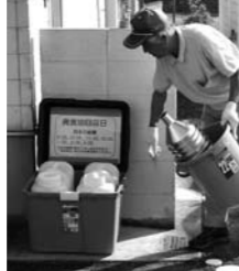
回収場所では廃食用油回収ボックスに油を移し替えて下さい。

回収場所は、通常のごみと異なり、各町ごとに、公民館、ごみターミナル等に定められています。回収場所は市HPにも掲載しています。十分確認の上、ご持参ください。