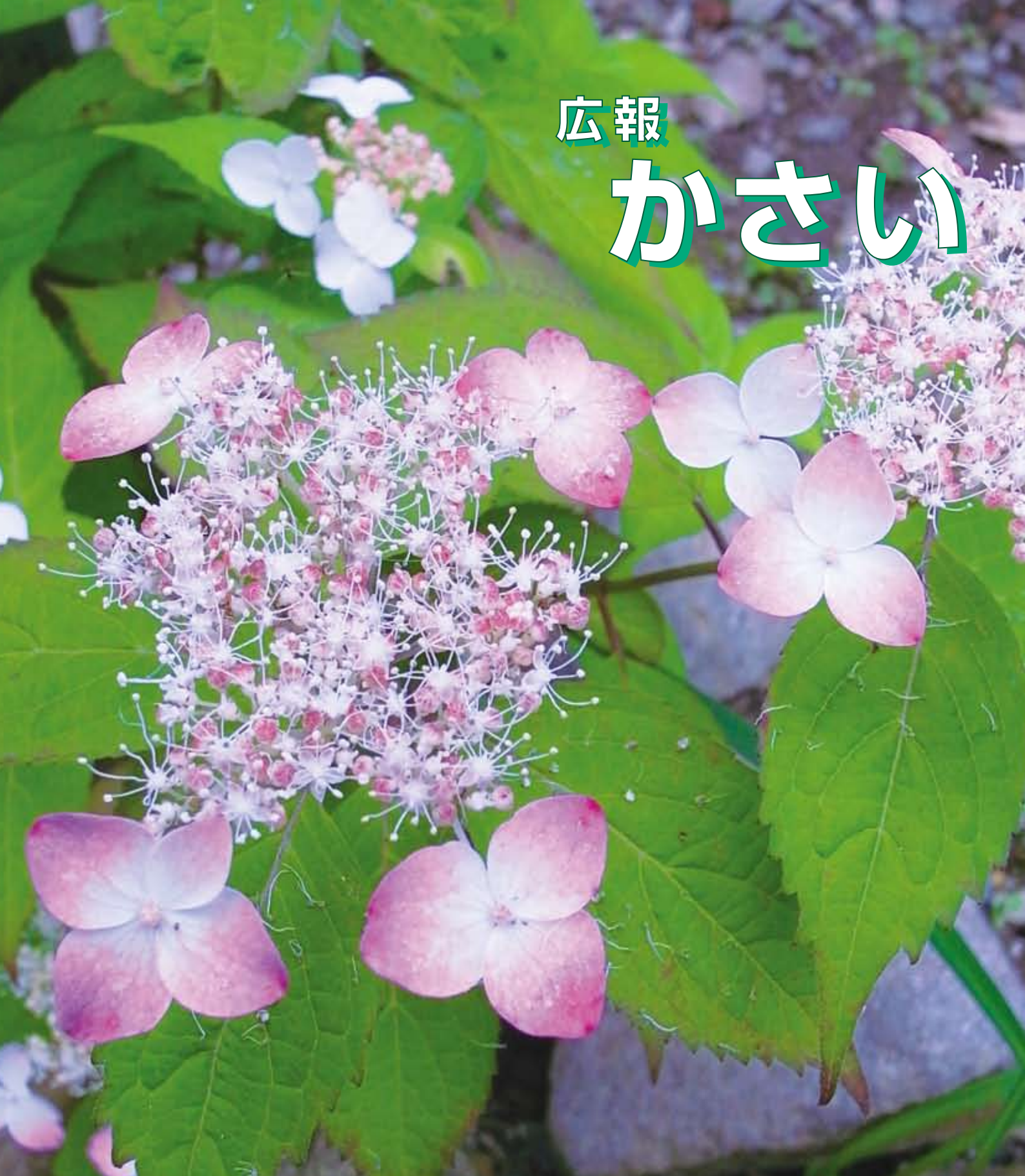
ヤマアジサイ紅（羅漢寺にて）

表紙の写真(市内の美しい花や風景など)を募集しています。 詳しくは経営戦略室までお問い合わせください。