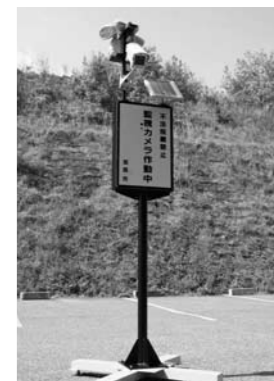
導入した監視カメラ

加西市は、ごみの不法投棄対策として専用の監視カメラ1台を導入しました。今後、加西警察署地域課及び生活安全課や各町の区長とも協議するなどして、不法投棄が多発する場所を聞き取りし、順次、設置・監視を行います。 監視カメラの概要：人感センサー等により反応、監視データを記録。電源はソーラーバッテリーを利用して、電源のない山中にも設置可能。夜間でも鮮明に撮影できる。 問合せ先：資源リサイクル課 ☎④ 0401