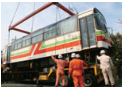
「フラワ1985」搬出作業の様子

北条鉄道開業以来24年間走り続けてきた車両フラワ1985が3月31日、和歌山県御坊市の紀州鉄道に売却され、搬出作業が行われました。走行距離は100万キロを超えています。紀州鉄道へは2000年にも同型車両が売却され、同社では北条鉄道の旧車両2両が走るようになります。