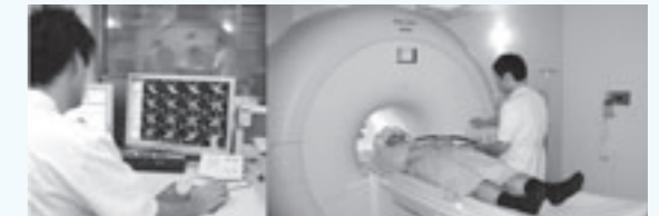
▲加西病院に設置されたMRI。

加西病院のMRI装置が最新の機器に更新されました。従来に比べて磁場が強く、より診断精能の高い画像が得られます。脳神経疾患、整形外科疾患、腹部疾患、耳鼻科疾患などに威力を発揮します。