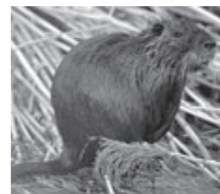
ヌートリア（学名：Myocastor coypus ミオカストロ・コイプス）南米原産