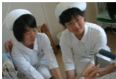
▲ 中高生によるふれあい体験。

また、加西中学校吹奏楽部と病院コーラス部「きらり」の「ふれあいコンサート」が開かれ、入院患者の皆さんは、心なごむ一時を過ごされました。