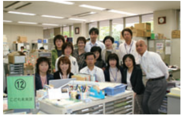
▲ こども未来課のスタッフ一同。市民の皆さまが立ち寄りやすいよう1階南側で仕事をしています。

子どもたちが健やかに育っていくために、保育所・幼稚園・幼児園・児童福祉の仕事をしています。