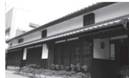
▲北条の歴史的な町並み