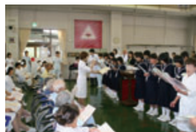
▲ ふれあいコンサートの模様。