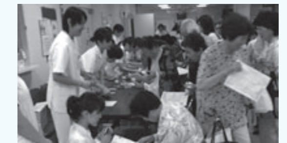
▲前年のホスピタルフェアの様様。

期の医療目標が達成され退院を促しても「人手の都合がつかない」とか「帰って悪くなったらどう責任を取る」と医療現場を困らせます。このような社会的入院がベッドを占拠すると重症な患者を受け入れられなくなります。そのために、病院職員は患者・家族の皆様は在宅療養や介護保険制度に係る情報を提供して、長年住み慣れた家や地域で生活できる様に支援しています。ご理解とご協力をお願いしたく存じます。(病院長)