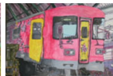
▲ ステーションマスター賞 桜井峻佑くん(北条小6年)