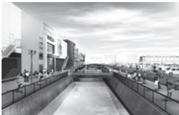
▲ 下里川を活かした親水プロムナード（遊歩道）

観光振興の面からも、観光研究会の部会を中心に、大規模商業施設のオープンに合わせ、賑わいと市街地の再発見を促すイベント企画を次頁のとおり予定しています。