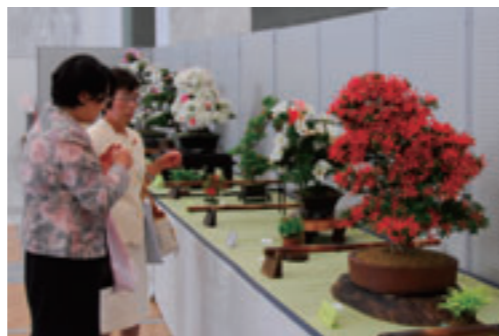
加西市さつき展の会場。▶

加西市さつき展がアステアかさい3階地域交流センターにて5月30日から三日間開催。加西市さつき同好会の皆さんを中心に丹精こめて育てた、さつき盆栽と山野草が24点展示されました。