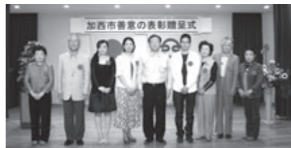
▲サルビア賞を受賞されたみなさん。

サルビア賞は、市の花である「サルビア」の群生の集団美をたたえる意味で団体に贈られます。