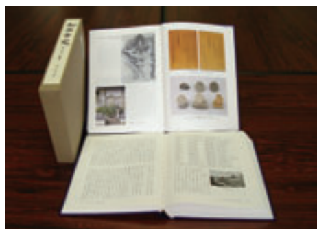
▲ いよいよ登場の第一巻。

販売場所：市史・文化財室分室(市団体事務所2階)、教育委員会 市内公民館、地域交流センター、西村書店、毛利書店