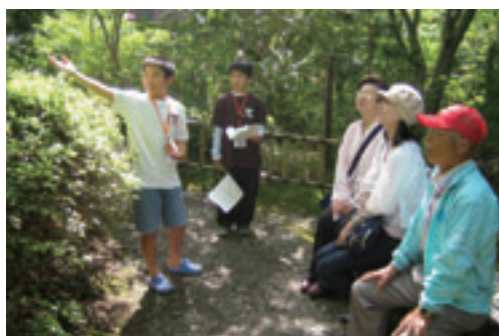
▲ 歴史ガイドをしている小学生。