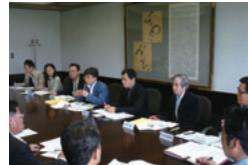
▲ インタビューを行う教授・学生。