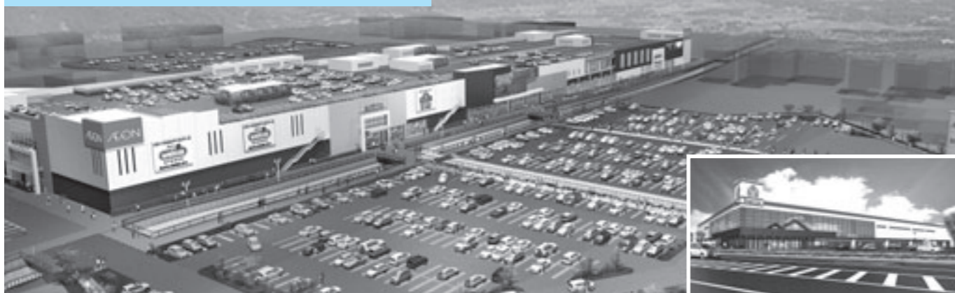
(商業施設完成予想図)