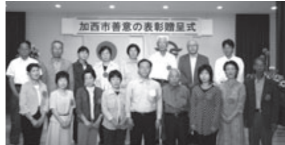
▲ かしの木賞を受賞されたみなさん。

かしの木賞は、市の木である「かし」の一本のたくましさになんて、個人に贈られます。