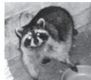
アライグマ（学名：Procyon lotor プロキュオン・ロトル）北米原産

なお、アライグマ・ヌートリアには寄生虫などの感染症、特にアライグマは回虫・狂犬病を保有している可能性があり、噛まれたり引っかけられたりしないよう注意してください。