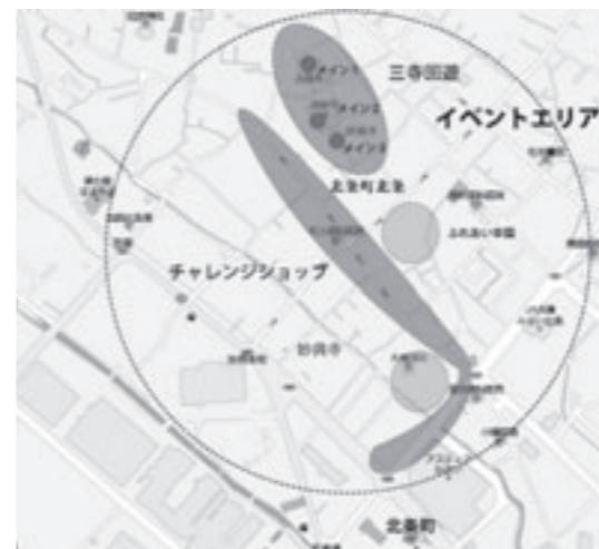
▲ イベント予定範囲