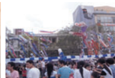
▲ ハノイの空の下で泳ぐ鯉のぼり。