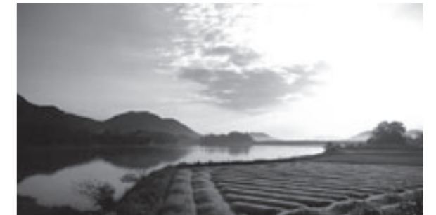
詳細はふるさと納税専用ページへ http://www.hyogo.city.kasai.hyogo.jp/furu