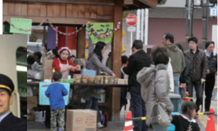
賑わいの北条町駅 3月20日。「ミニ鉄道まつり in 北条町駅」を開催。駅待合室では、鉄道模型の走行展示、鉄道グッズの販売、制服を着ての記念撮影が行われ、駅前バスロータリー付近ではベトナム料理や手作りパンなどの国際屋台、そして待機車両内や駅前アスティアかさいではミニコンサートも行いました。