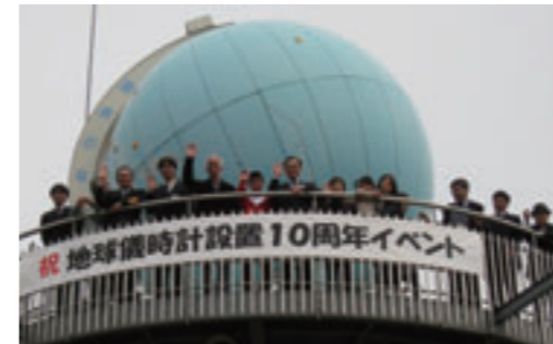
「世界一の地球儀時計」生誕10周年 丸山公園にある地球儀時計（1998年1月にギネス認定）の生誕10周年を祝って、記念イベントを開催。地球儀内部から出てきたタイムカプセルも開けて、当時の新聞記事などを懐かしく眺めました。