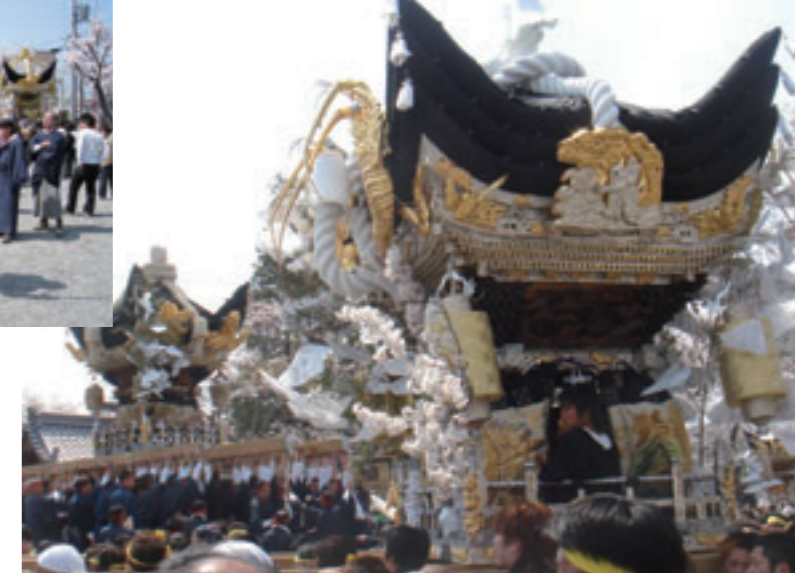
よいやさあ〜北条節句まつり 4月5日、6日。澄み切った青空のもと、北条節句まつりが盛大に開催されました。