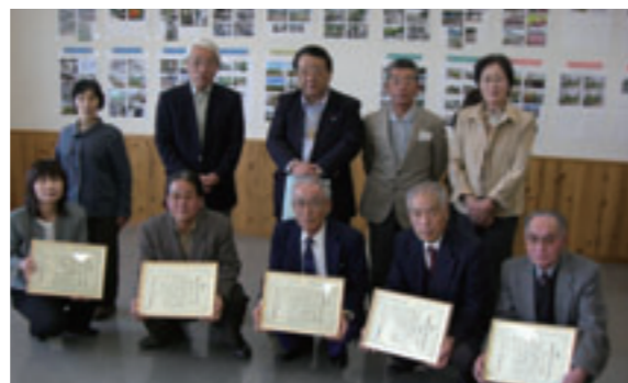
第2回「花と緑の美しい北播磨」コンクール 北播磨県民局管内において花と緑の美しい北播磨コンクールが行われ、加西市から5団体が受賞されました。 優秀賞：高峰クラブ 努力賞：南町緑のグループ・はばたんの風 奨励賞：鶴野中町老人クラブ・富合小学校