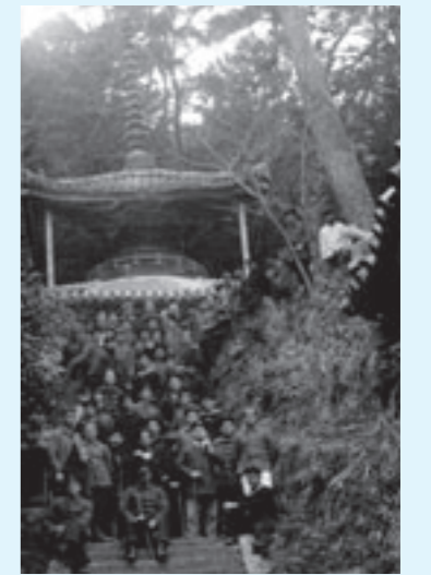
写真 当時の多宝塔と俘虜たち (ドイツで発見された写真)

この時期、奥山寺は紅葉で一色に染まります。紅葉と共に俘虜たちの感じたものを追体験してみるのも一興ではないでしょうか。