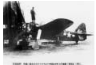
▲鶉野飛行場最後の紫電

恒例となりました、鶉野飛行場の展示を行います。今年も局地戦闘機「紫電・紫電改」や白鷺隊員の遺書に加え、「忘れられた列車転覆事故」の全容の展示を行います。 日時：8/6(月)～8/31(金) 場所：加西市役所1階ロビー