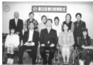
受賞者のみなさん