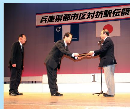
永きに渡り「駅伝王国兵庫」を支えたとして、兵庫陸上競技協会から、加西市及び加西市陸上競技協会へ感謝状が贈呈されました。

●ホームページ http://www.city.kasai.hyogo.jp ■広報がさいは、資源保護のため100%再生紙を使用しています。