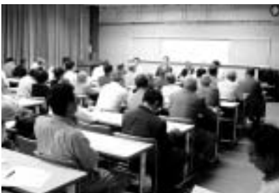
登記済証交付の様子。

長年の懸案であった中西地区換地整備事業の換地処分登記が関係者のご協力により、9月末に完了しました。10月17日に善防公民館にて登記済証等の交付を行いました。まだ交付を受けておられない方は市役所5階地籍用地課までお越しください。