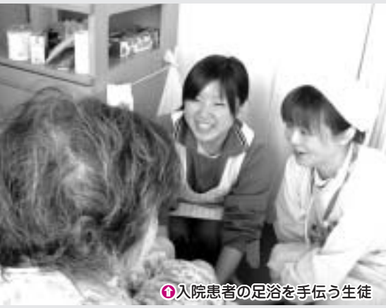
①入院患者の足浴を手伝う生徒

2月6日(月)~10日(金)の5日間、北条高校2年生がインターンシップ(職場体験)を行いました。加西病院では、生徒4名が看護師の職場を体験し、入院患者の血圧を測定したり、足浴の手伝いをしました。仕事の厳しさや働くことの大切さを学び、実習を通じ自分の将来を考えるこの職場体験、参加したある生徒は「看護師の仕事を実際に体験して、その大切さや大変さがわかりました。将来は看護師のような人を助ける仕事をしたい。」と話していました。