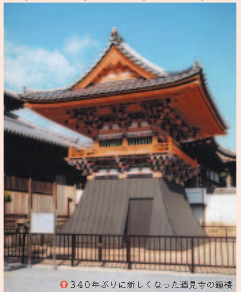
340年ぶりに新しくなった酒見寺の鐘楼

加西市を愛し、加西市に誇りをお持ちの方なら年齢・性別を問いません。 ◆問合せ・申込み／加西市観光協会 (☎08823)