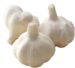
おう ハリマ王にんにく