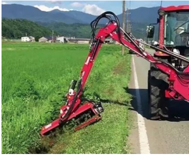
アーム(ブーム)モア