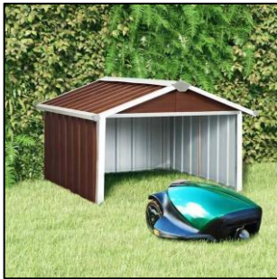
ロボット草刈り機