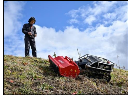
ラジコン草刈り機