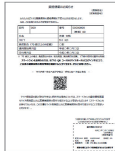
資格情報のお知らせ (A4サイズ)