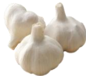
おう ハリマ王にんにく