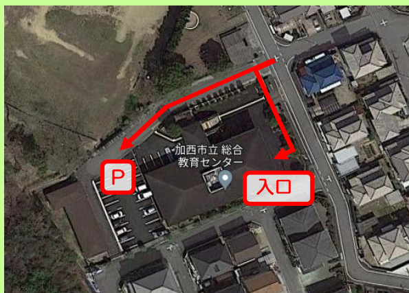
送迎駐車場・ふれあいホーム入口