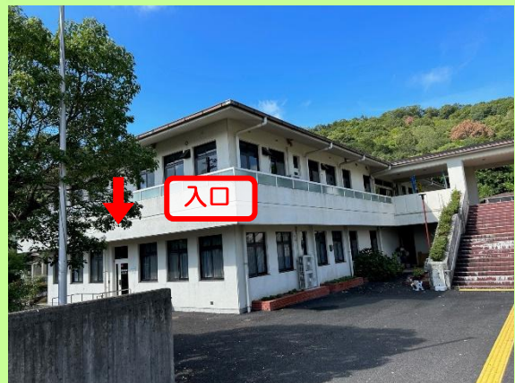
1Fから直接入れます