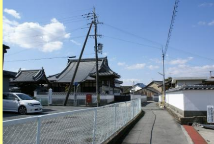
・社寺に隣接する駐車場