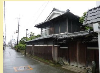
○本町、福吉町付近のまちなみ