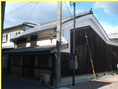
・町家のよさを残して改修されている建物