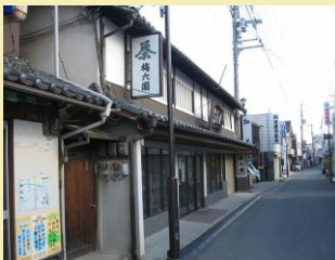
○御旅筋のまちなみ