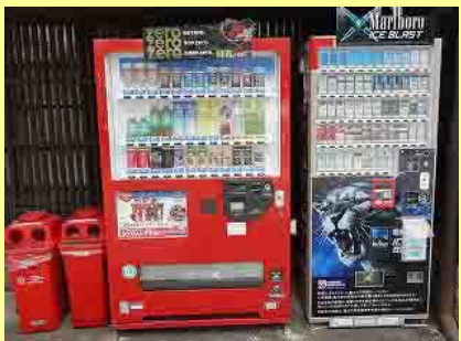
・際立つ色彩の自販機