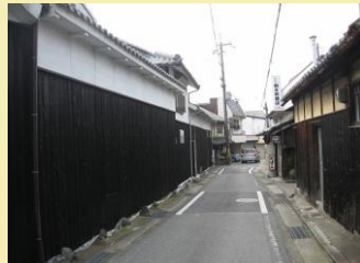
○姫路街道のまちなみ