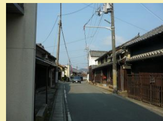
○丹波街道のまちなみ