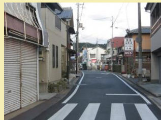
○本町筋のまちなみ