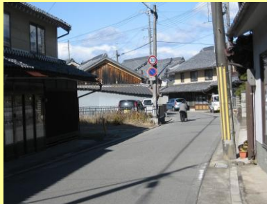
・緩やかに曲がる丹波街道