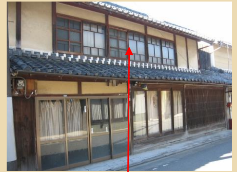
白漆喰壁・黄土色の土壁