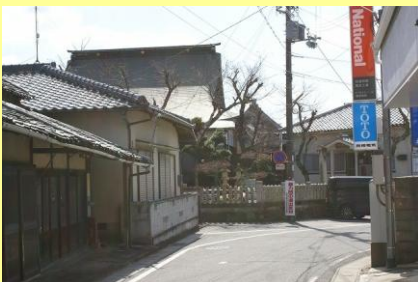
・磯部神社、大信寺周辺