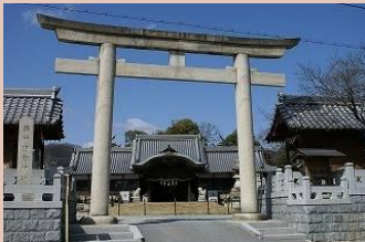
・住吉神社や酒見寺