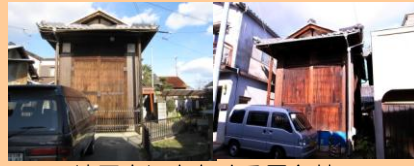
・地区内に点在する屋台蔵