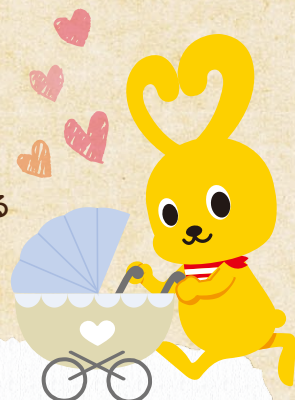
コープこうべキャラクター コーピー

※加西市からの業務委託を受けてコープこうべがかさいすくすく子育て定期便事業を行っています。