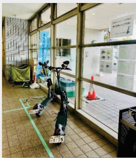
市役所1階貸出しポート