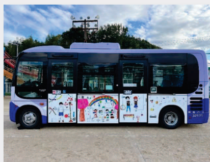
完成したおえかきバス