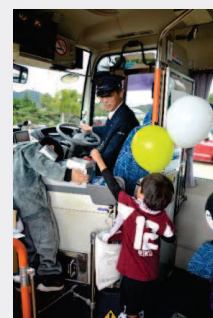
乗り方教室の様子