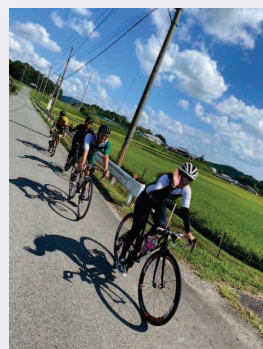
サイクリング風景