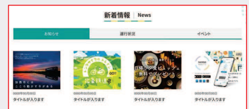
「お知らせ・運行状況・イベント」情報を発信

デジタル田園都市国家構想交付金（地方創生推進タイプ）を活用し、R5年度からの3年間で段階的なバージョンアップ（経路検索機能、デジタルチケットなど）を経て、MaaSツールとしての活用を狙う。