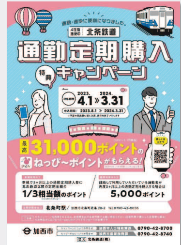
キャンペーンチラシ