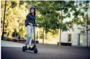
電動キックボードを活用した実証実験