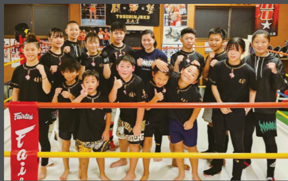
ジム仲間と。子どもたちには指導もしている（後列中央）