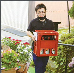
使い古された地図を相棒に、お得意先へ

き、平釜で小麦を炒り、麴蓋などの道具で仕込み、長期間醸造。天秤秤に石を吊るした木製天秤搾り機でゆっくりと諸味を搾り出します。機械とは違い、雑味がない美味いところだけを搾り出すことができるそうです。四季の移ろいにかかせて長期間醸すことで、旨みが詰まった醤油本来の濃い味わいに仕上がります。この醤油を「古式しょうゆ」と名付け、昔ながら