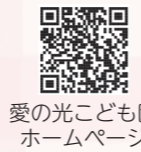
愛の光こども園ホームページ

●入園体験デー ※15組限定 日時：9月2日(土) 9:30～11:00 ※要申込(参加人数を制限しています)