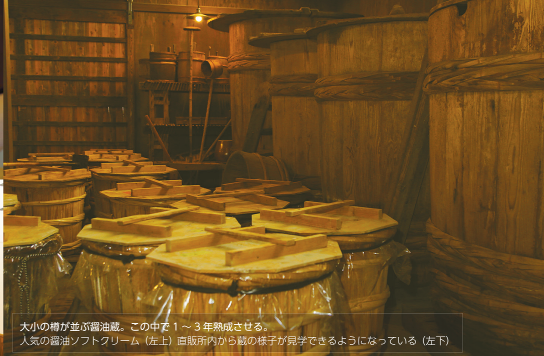
大小の樽が並ぶ醤油蔵。この中で1~3年熟成させる。人気の醤油ソフトクリーム(左上) 直販所内から蔵の様子が見学できるようになっている(左下)