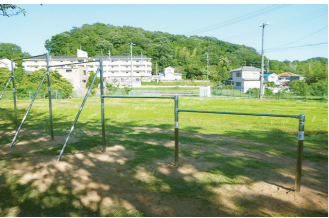
新たに設置した鉄棒

吉野町自治会は、一般財団法人自治総合センターの宝くじ社会貢献広報事業として、宝くじの受託事業