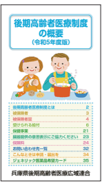
同封のパンフレット

被保険者証の更新時期は毎年8月1日です。7月中旬に簡易書留郵便で新しい被保険者証を送付します。8月1日から新しい被保険者証を医療機関等の窓口で提示してください。保険料の納付状況によっては、有効期間が短い被保険者証(短期被保険者証)を送付することがあります。納付が困難な事情がある場合は早めに相談してください。