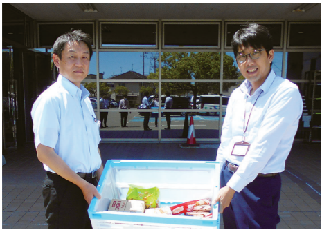
但陽信用金庫入江課長(左)と地域福祉課長

生活にお困りの方等に配り、地域福祉の向上に役立てます。感謝申し上げます。 問合先：地域福祉課 ☎07520