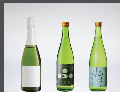
IWCで入賞した酒。左から「祝泡」「特別純米山田錦」「純青」の3銘柄

昭和46年生まれ。大学卒業後、酒類総合研究所に入所。25歳の時に実家へUターン。営業、ふく蔵での勤務を経て、平成25年、8代目社長に就任。翌年、新ブランド「純青」を立ち上げる。県内5つの地酒蔵元でつくる「HYO5KURA（ひょうごくら）」の発起人。趣味は盆栽、旅行。1男2女の父。