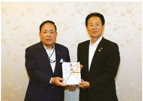
目録を手渡す川西会長(左)