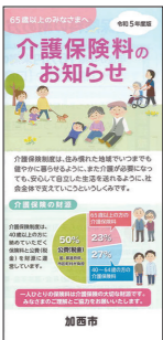
同封のパンフレット

7月中旬に令和5年度介護保険料決定通知書を送付しますので、詳しくは同封のパンフレットをご覧ください。