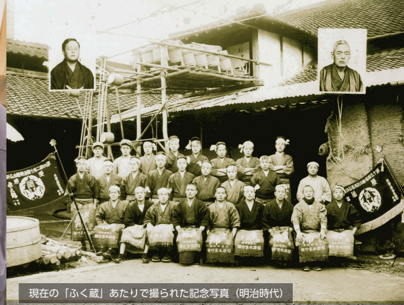
現在の「ふく蔵」あたりで撮られた記念写真（明治時代）