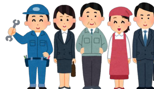
（加西市就労準備支援事業）