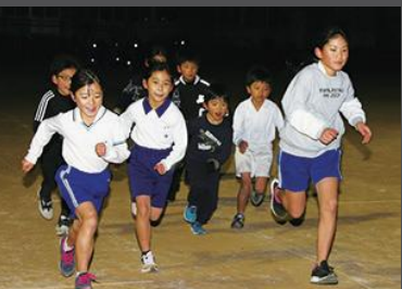
その日の目標を立てて本数をこなす。しんどい練習も声を掛け合い走り抜ける。

加古川でも週に2日は陸上を教えています。加西の教室と合わせると1日も休みはありません。「野菜作りが唯一の息抜きかな」と一瞬顔がほころぶ。獲れた野菜は子どもたちにお裾分けすることもあります。