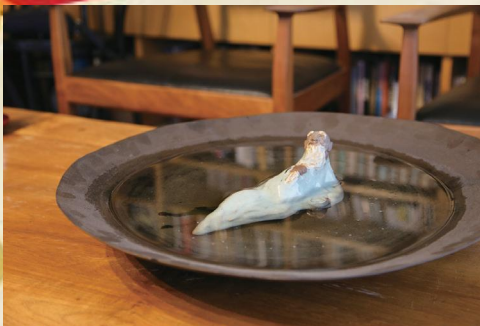
スタジオに置いてある大きな器。大切なピアノの乾燥を防ぐため、お水を張るという気配りが。

民輪 加西市というのは、自然豊かで、蛇や虫が好きな子もいれば嫌いな子もいる。そういう中で育っているからこそ、人間ならではの批評精神や自分自身の論理を、未来に向かって構築できる子を育てたい。ただ昔を懐かしむだけじゃなくってね。そうした力を、これから先の予測できない未来に向かってどう育て、社会を動かしていくか。挑戦し、他者を大事にする子どもを育てましょうということ、加西STEAMと名付けました。今、