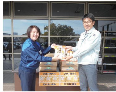
加西店店長（左）から地域福祉課長（右）への手渡しの様子

令和4年11月17日（木）、生活協同組合コープこうべ加西店から加西市地域福祉課に無洗米を96kg（2kgを48袋）いただきました。コープこうべが集められた「お米を贈ろう助け合い募金」の中から寄付としていただきました。このお米は生活困窮者に配りまします。ほかに加西市にある2カ所のこども食堂にも配られました。毎年定期的にいただいております。地域の福祉のために役立ててまいります。感謝申し上げます。問合先：地域福祉課 ☎ 7520