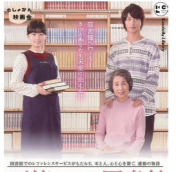
天使のいる図書館