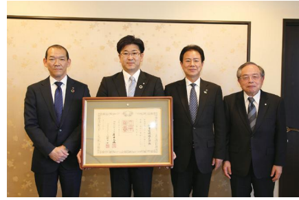
(左から)岡田本部長、伊東社長、西村市長、岡監査役