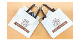
図書館特製トートバック福袋

マイナンバーカードで図書資料の貸出ができます。希望の方は、手続きが必要です。図書館カードとマイナンバーカードを持って図書館窓口へお越しください。 登録キャンペーン：3月14日(月)からマイナンバーカードでの図書館利用登録または貸出をされた方に、雑誌付録福袋を差し上げます。(先着100名、1人1回限り)