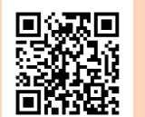
図書館ホームページ

加西市立図書館 〒675-2312 加西市北条町北条 28-1 (アステアかさい内) ☎ 42-3722 fax 45-3133 toshokan@city.kasai.lg.jp 開館時間：10:00～18:00 休館日：毎月末日・年末年始