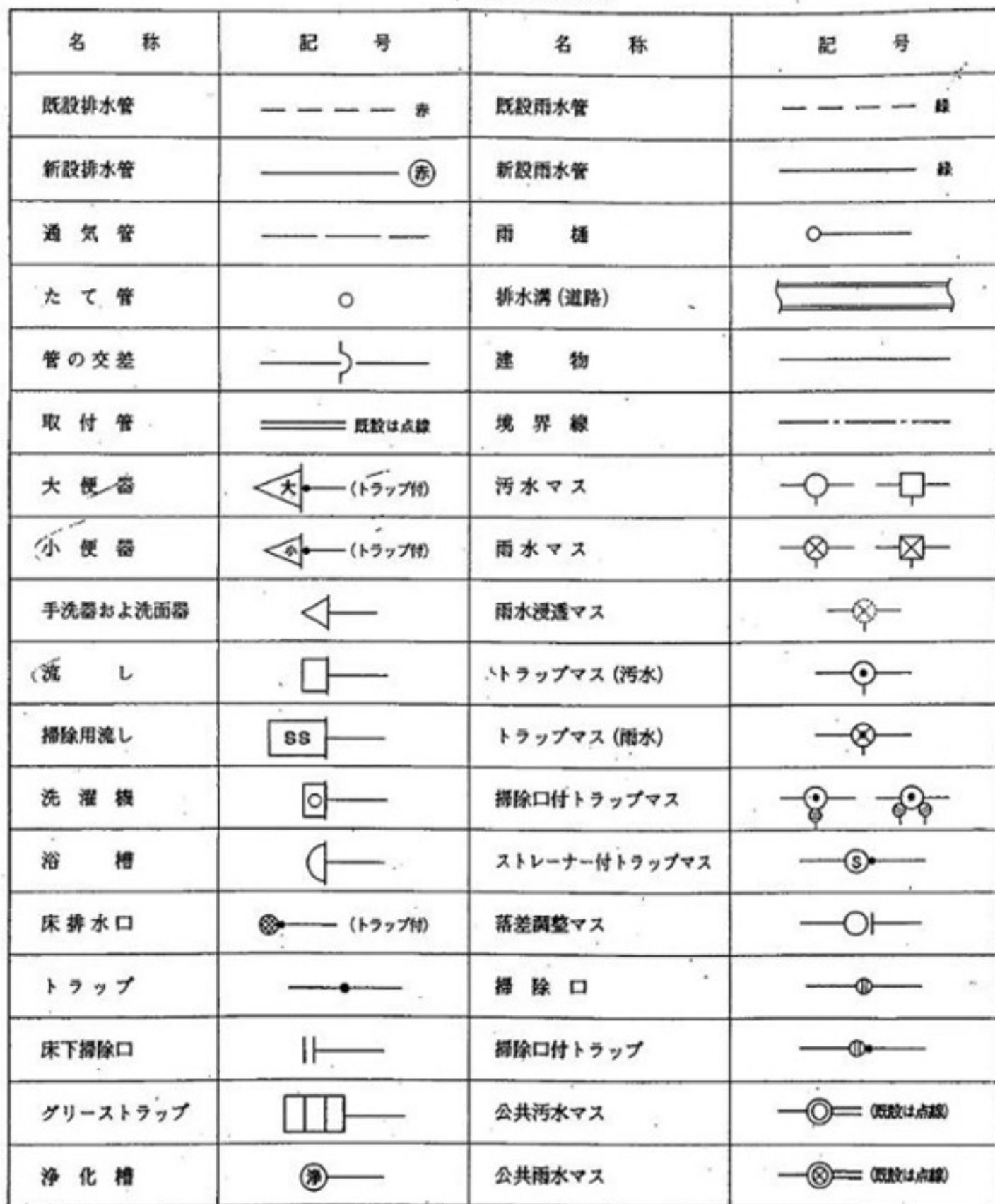
設計図の記号の例