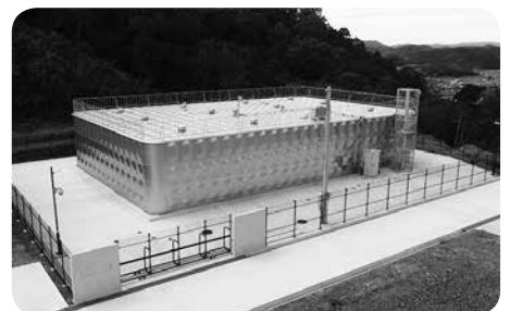
県水を供給する鴨谷配水池