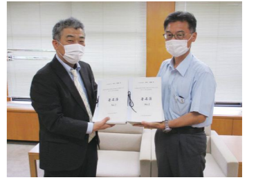
兵庫県教育委員会へ陳情書および署名簿を提出

北条高校の活性化に向けた取り組みを行う北条高校活性化協議会は、8月2日(月)に兵庫県教育委員会を訪問し、現在の1学年3学級を来年度には4学級に戻すよう求める陳情書と署名簿(1万3072筆)を提出しました。