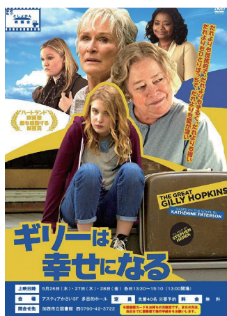
上映期間：5月17日(水)～28日(金) 毎日19:30～19:50(18:00開場) 7/29(土)～8/1(日) 毎日19:30～19:50(18:00開場) 料金：全席自由 観覧料100円 上映：加西市立図書館 07790-42-3722

転々としている12歳の少女ギリリー。いつか本当の母親と暮らすことを夢見る彼女は、新しい養母のもとや転入先の学校でも反抗的な態度ばかり取ってしまう。そんなある日、実母から手紙を受け取ったギリリーは、母の元へ行くことを決意。心優しい盲目の隣人ランドルフさんからお金を盗んで大陸横断バス乗り場へと向かうが…