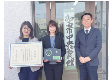
▲中央公民館の皆さん

中央公民館では、「地域で学び、伝統や文化を次世代に引き継ぐ」をキャッチフレーズに、子どもたちが楽しく「いけ花」「茶道」「盆栽」「和菓子作り」など日本の伝統文化に触れる機会を創出しました。また、地域の歴史や文化遺産を学び・伝えるボランティアガイド養成講座の開催など、地域住民の学習活動機会の創出や、地域の伝統や文化を次世代に引き継ぐ活動への貢献などが高く評価されました。