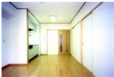
L D K