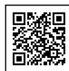
多言語観光情報サイト Guidoor（ガイドア）