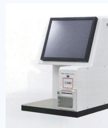
自動貸出機イメージ

利用者、図書館職員ともに非接触での貸出・返却が実現できることから、ソーシャルディスタンス（社会的距離）を充分保ち感染リスクの低減を図ります。コロナ禍においても安全・安心な図書館運営を継続していきます。