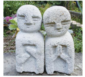
▲高さ30cm・幅10cm。 ノミと金づちを使って制作