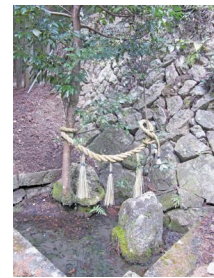
◀夫婦円満の夫婦岩