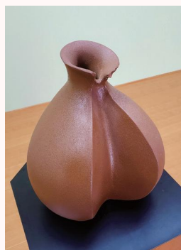
●彫塑・工芸 竜田姫